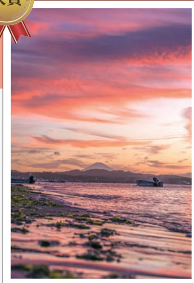
第5回 写真大賞