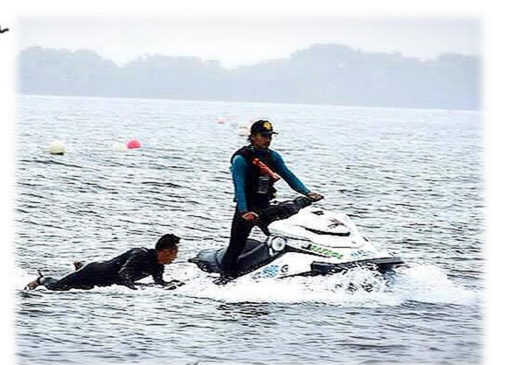
写真:水上スポーツ競技会での監視活動