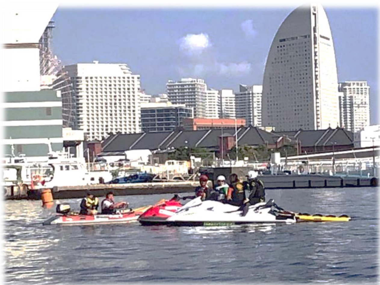
写真:水上スポーツ競技会での監視活動

陸上からの監視 2箇所 水上パトロール 14日間 水上スポーツ競技会 での監視活動 12日間