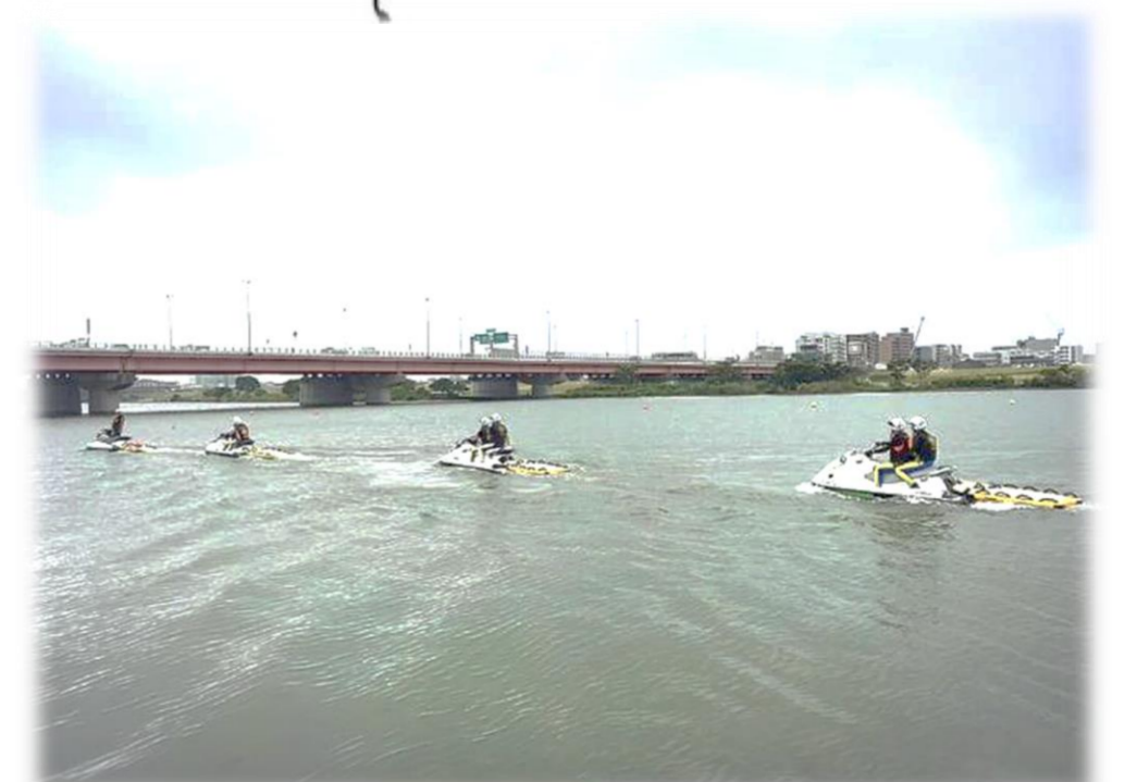
写真:水上パトロールの様子