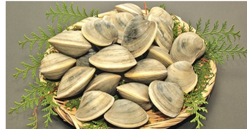
新・江戸前名物 ホンビノスガイ