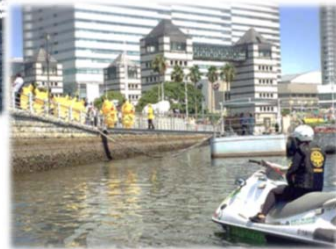
写真: ピカチュウだけじゃないピカチュウ大量発生チュウ!