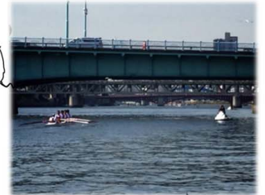
写真: 早慶レガッタ