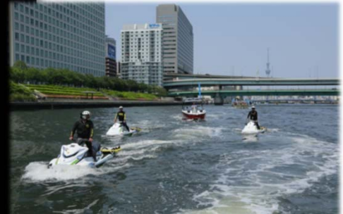
写真: 水上パトロールの様子