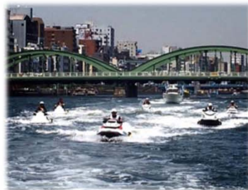
写真: 隅田川安全航行パレード