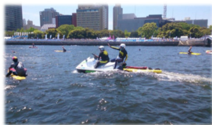
写真: 横浜国際トライアスロン大会

陸上からの監視 2箇所 水上パトロール 16日間 水上スポーツ競技会 での監視活動 19日間