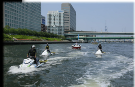
写真: 水上パトロールの様子