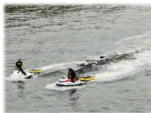
写真: 早慶レガッタ大会(隅田川) 水没事例のレスキューの様子