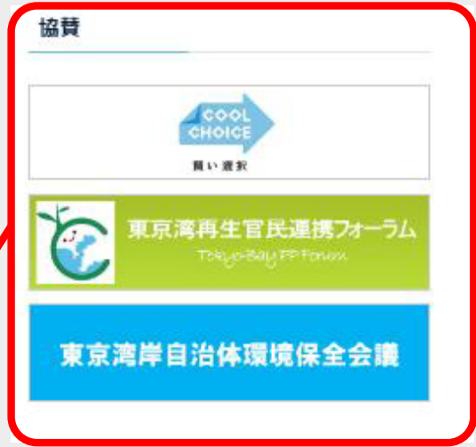
バナー掲載イメージ